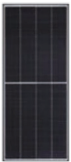
Q.PEAK DUO MS-G9 235