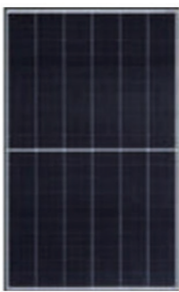
Q.PEAK DUO-G9 355